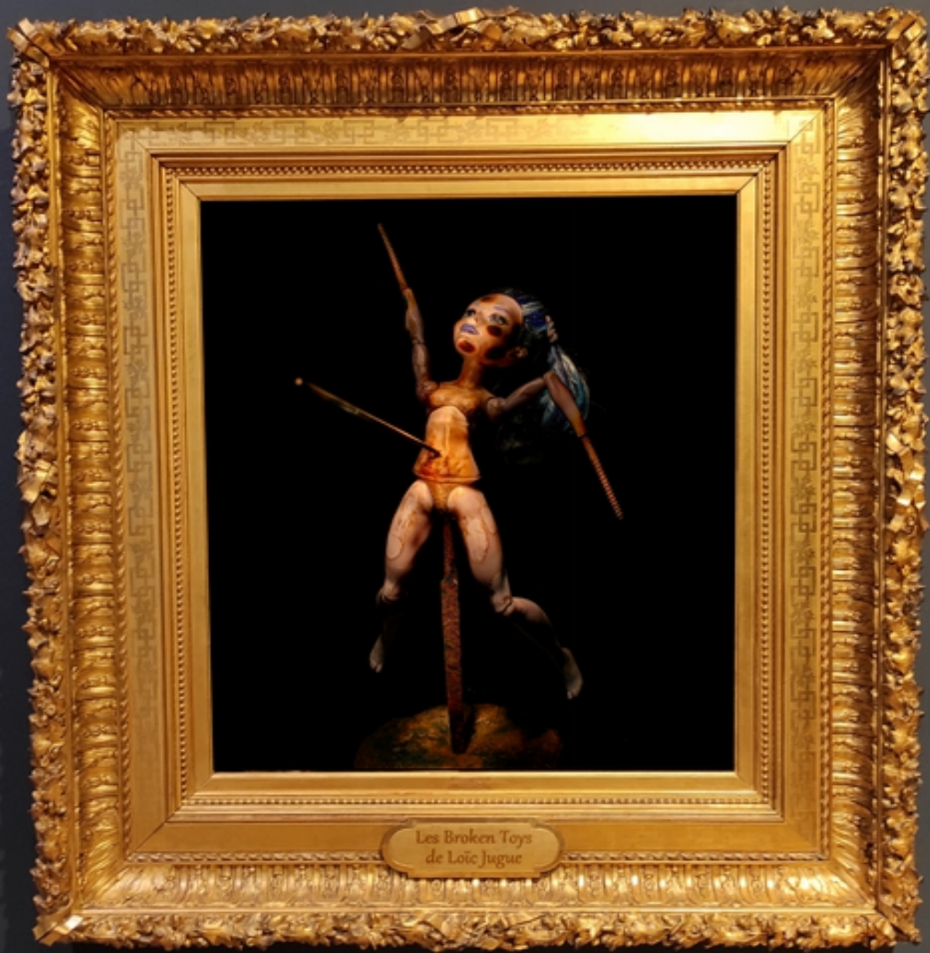
Les Broken Toys de Loïc Jugue